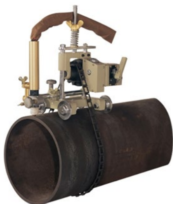
BLM TubeCut OxyP Electric